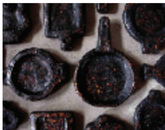
新村 秀人 (石川県金沢市)