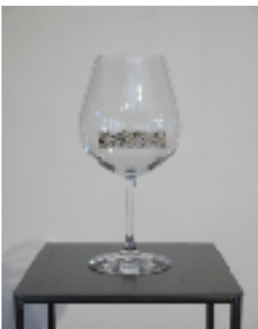
吉備 匠 (東京都中野区)