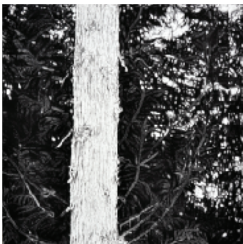
山あるき 二月 2011