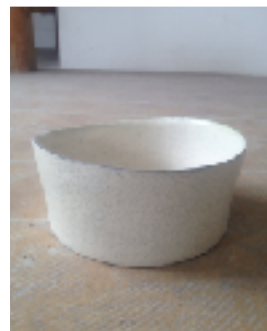
横山 拓也 (岐阜県多治見市)